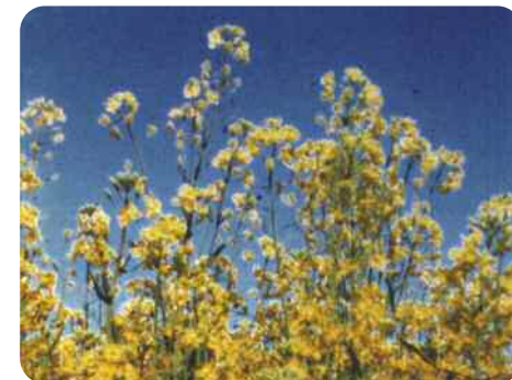
vers 1960, Ciné-concert Les Paysans par eux-mêmes