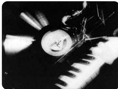
Disque 957, Germaine Dulac, 1928, L'Avant-garde 1920-1930