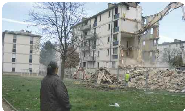
Beaulieu (re)prise de mémoire, par des habitants du quartier Beaulieu et l'aide de Ciclic

Habitants et professionnels ont opéré ce travail qui a abouti à l'élaboration d'une exposition, l'écriture d'un recueil de paroles et la réalisation d'un documentaire retraçant l'histoire, la vie du quartier et de ses habitants, leur permettant ainsi de laisser une trace et d'appréhender leur patrimoine.