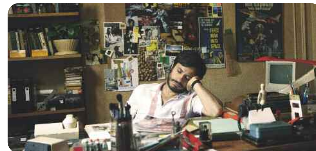
Nó, Pablo Larraín

Biographie d'un personnage imaginaire, ce pastiche mêle documents d'archives trafiqués et fausses archives réalisées avec des trucages extraordinaires. Vrai tour de force technique, Zelig est une joyeuse irrévérence vis-à-vis de l'histoire du document et autres mythes du sérieux cinématographique. Le film est aussi une magnifique réflexion sur les paradoxes de la folie et de la normalité, une fable burlesque aux significations multiples et presque illimitées. Zelig est également un film drôle, l'idée d'un homme-caméléon est d'une grandiose absurdité comique !