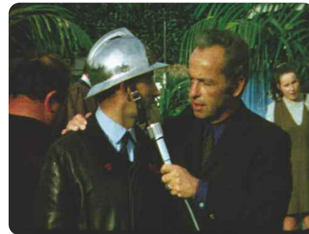
Ciclic, Jacques Nouhaud, 1968

Seront ainsi présentés des jeux d'enfants sur la place Gambetta à Châteauroux, une fiction de 1924 rappelant les films burlesques, un voyage aventureux à Madagascar, une fantasia au Maroc, une visite à Valençay, des disparitions mystérieuses et des apparitions de fantômes.