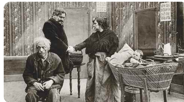
Germinal , Albert Capellani

En écho à la présentation de Germinal , à 20 h 45, voici un programme qui témoigne de l'importance de la figure du mineur après la Seconde Guerre mondiale. Les « gueules noires » furent à la fois la figure héroïque de la Reconstruction en produisant l'énergie dont la France avait besoin pour se relever et la représentation par excellence de la victime de l'exploitation capitaliste. Comment ce corps de métier a-t-il été choisi entre tous par le Parti Communiste français pour symboliser la classe ouvrière ? C'est ce que nous découvrirons à travers cette sélection composée d'actualités, de documentaires, de fictions, de bandes-annonces issus du fonds de l'association Ciné-Archives.