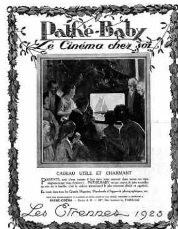
Publicité pour le Pathé-Baby, L'Illustration, 1923

Durée : 20 minutes. Entrée libre. Voir en page 13.