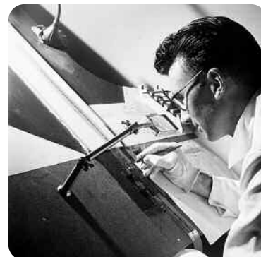
Norman McLaren dans son atelier, ONF

Projection en salle à 20 h 45 des films réalisés les jours d'ateliers.