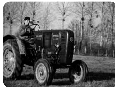
Ciclic, Louis-Eugène Pintaux, 1949

Prévoyez 25 minutes à consacrer, au choix : avant et après les séances de 15 h et 17 h 15 et avant la séance de 20 h 45.