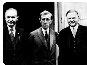
Zelig, Woody Allen

Présentation et discussion avec Matthias Steinle , qui travaille sur la forme du documenteur (voir page 4).