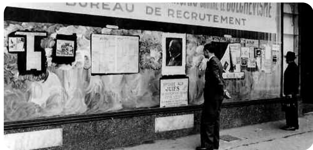
Le Chagrin et la pitié, Marcel Ophüls, Classiques Gaumont

Jean-Louis Bory, Le Nouvel Observateur , 1971