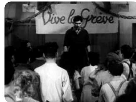
Horizons, réalisation collective, 1953, Fonds Ciné-Archives, La figure de la Gueule noire...

Ciné-Archives gère le fonds audiovisuel du Parti communiste français et du mouvement ouvrier et démocratique. Près de 1200 films, tournés à partir de 1928, sont conservés et valorisés par l'association. Ce patrimoine cinématographique permet un voyage dans le temps par le prisme communiste, témoignant des grands événements de l'actualité politique, économique et sociale du xx e siècle: du Front Populaire au Programme Commun, en passant par la reconstruction, la Guerre du Vietnam ou les «banlieues rouges».