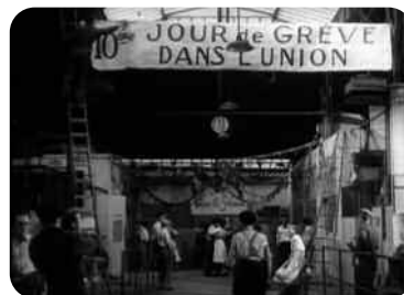
Horizons , réalisation collective, 1953

Servir ; La Grande lutte des mineurs ; Ma Jeanette et mes copains ont été restaurés par les Archives Françaises du Film du Centre National du Cinéma et de l'Image animée – Ministère de la Culture.