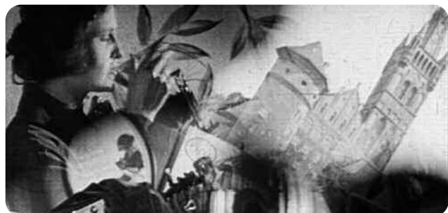
Kipho, Guido Seeber