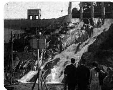
Éguzon, 1926