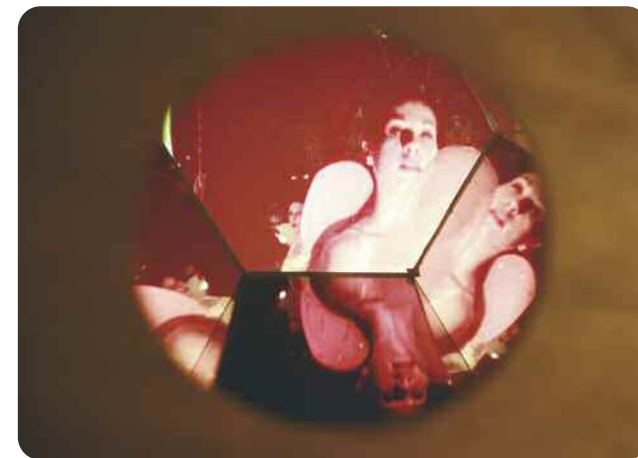
L'Incroyable histoire du Kinématographe, La Tortue magique